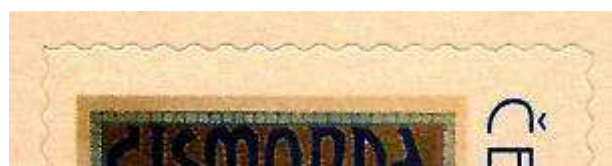
třetí náklad – „zakulacený“ pouze pravý horní roh