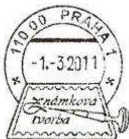
nové příležitostné razítko na poště Praha 1

Organizační změna se promítla v novém názvu - PRODEJNA ZNÁMKOVÉ TVORBY - i v omezení a zrušení některých poštovních služeb – jako např. používání denních razítek. Z tohoto důvodu se přestalo používat denní razítko a tři razítka s obrazovou částí „Pošťák“, „Kočár“ a „Známka pod lupou“. Současný organizační statut „pošta Praha 016“ byl dnem 28. 2. 2011 ukončen. Jako malou kompenzaci zaniklých denních razítek a razítek s obrazovou částí pošty Praha 016 jsme pro zájemce připravili nové, tzv. denní, razítko s obrazovou částí s textem Známková tvorba. Bylo zhotoveno podle návrhu rytce Martina Srba a používá se od 1. 3. 2011 u přepážky č. 17 pošty Praha 1 v Jindřišské ulici do odvolání.