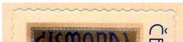
první náklad – všechny rohy „zakulacené“

U známky E je rozlišení sešitků oproti známám Z méně nápadné. První náklad není v místě přeložení sešitku opatřen průsekem, kresba na destičkách je vůči známám v normální poloze a použitý průsek má „zakulacené“ rohy. Druhý náklad je v místě přeložení sešitku opatřen průsekem, kresba na destičkách je vůči známám v převrácené poloze („hlavou dolů“), použitý průsek má tři „ostré“ rohy, levý dolní roh je „zakulacený“. Třetí náklad je v místě přeložení sešitku rovněž opatřen průsekem, kresba na destičkách je vůči známám v normální poloze, použitý průsek má také tři „ostré“ rohy, „zakulacený“ je pravý horní roh. Rozlišit lze i samostatné známky podle použitého průseku – u prvního nákladu jsou všechny rohy „zakulacené“, u druhého a třetího nákladu jsou tři rohy „ostré“ a jeden „zakulacený“.