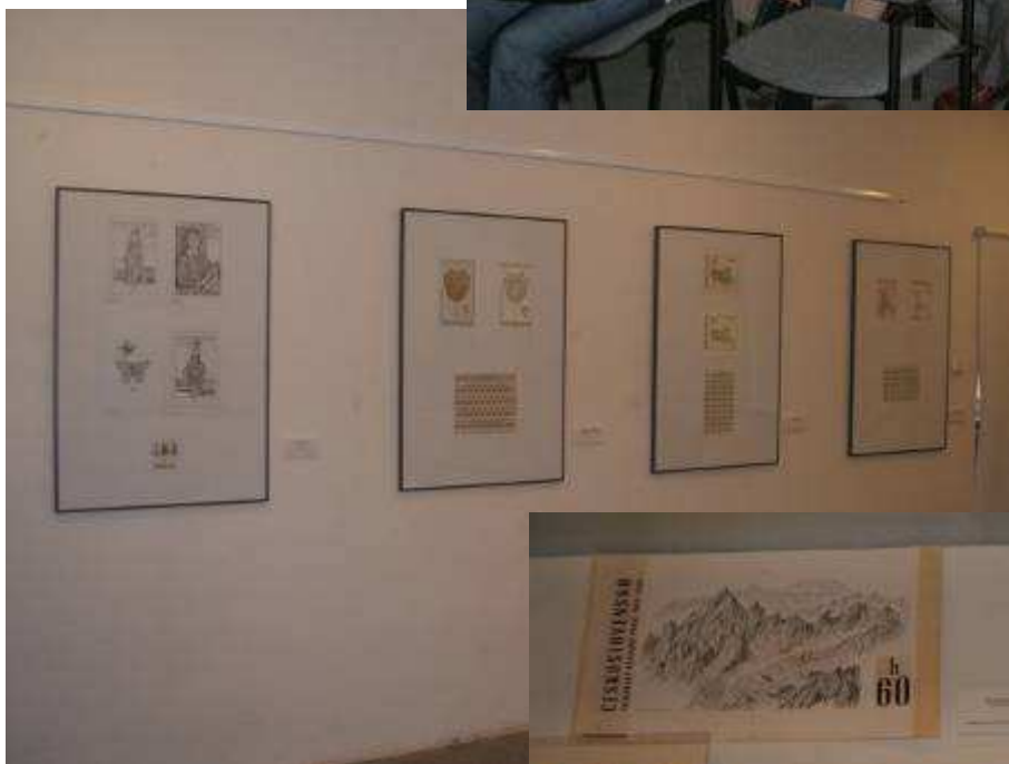
Pohled do výstavních prostor a ukázka vystavených děl