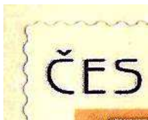
odlišný průsek u známek Z, vlevo první náklad a vpravo druhý náklad

U známky Z lze oba sešitky rozlišit velmi snadno. První náklad byl tištěn ze šesti polí (viz. rozlišení tiskových polí uvnitř sešitku), v místě přeložení není opatřen průsekem a trubka v logu České pošty na zadní straně sešitku je tištěna fialovou barvou. Druhý náklad je tištěn již pouze ze čtyř polí, v místě přeložení je sešitek opatřen průsekem a trubka v logu České pošty je tištěna modrou barvou. Rozlišit lze i samostatné známky podle použitého průseku – u prvního nákladu jsou rohy „zakulacené“, u druhého nákladu jsou rohy „ostré“.