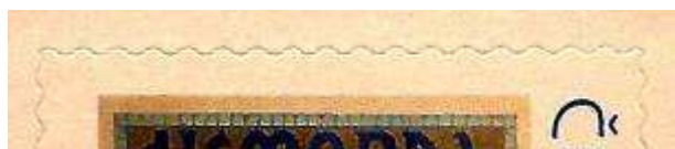
druhý náklad – „zakulacený“ pouze levý dolní roh