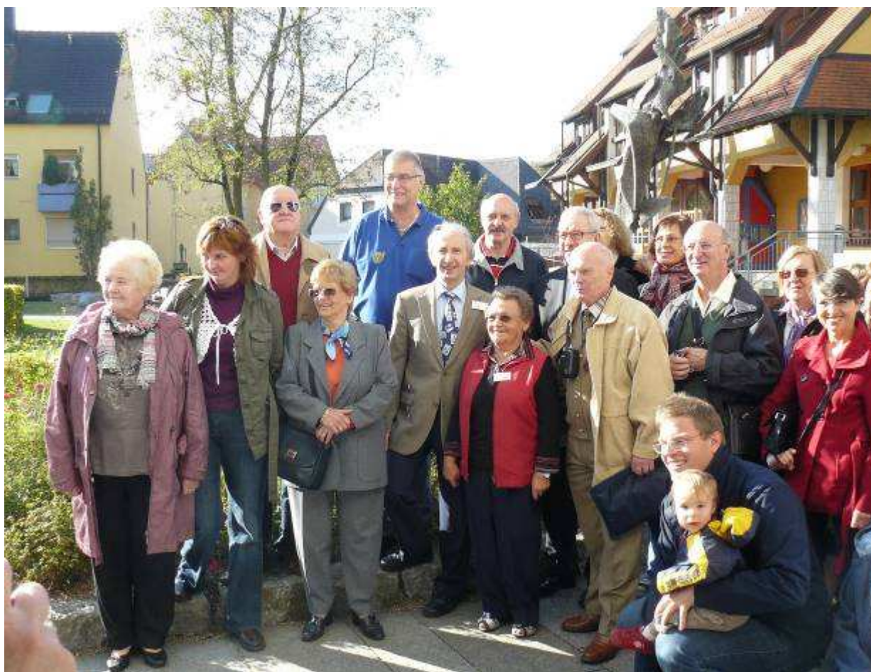
Společná fotografie před radnicí, kde se výstava konala.

V průběhu výstavy proběhlo setkání i s filatelisty z dalších partnerských klubů z Belgie, Francie a Rakouska. Kromě společného setkání u večere, jsme se zúčastnili i společného výletu po okolí, kdy jsme navštívili hrad Katzenstein a klášter v Neresheimu.